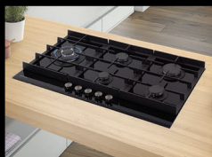
■ Варочные поверхности