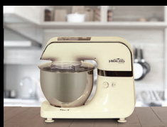
■ Планетарные миксеры