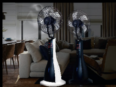
■ Вентиляторы с увлажнителем воздуха