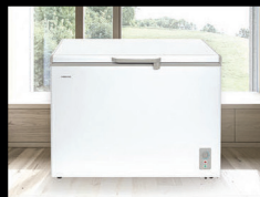
■ Морозильные камеры