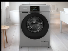
■ Стиральные машины