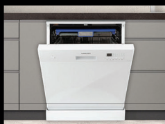
■ Посудомоечные машины