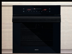
■ Духовые шкафы