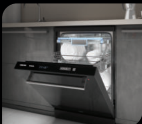
● Посудомоечные машины