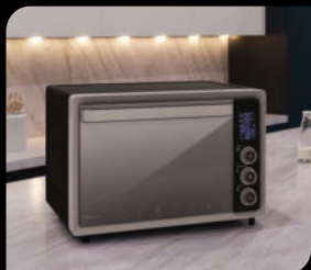
● Настольные духовки