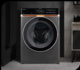
● Стиральные машины