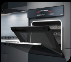
● Духовые шкафы