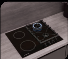
● Варочные поверхности