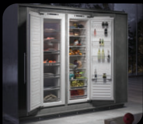
● Морозильные камеры